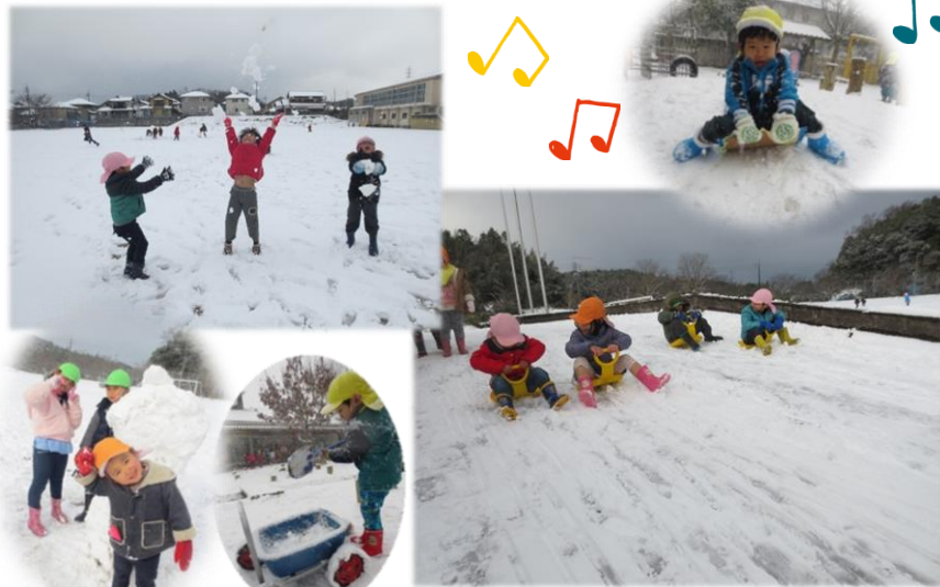
1月23日(土)のお餅つき会の様子です。

今年の冬は、例年より暖かい日が多く過ごしやすい日が続いていましたが、1月末にはびっくりするような寒波がきましたね。でも、本来の冬はこうであったように思います。子どもたちも、急な雪にびっくり！と思いきや、しっかり雪遊びを満喫していました。冬になると、寒いから外で遊んでいたら風邪をひきそうだと、つい家の中で過ごしてしまったり、暖かいショッピングセンターに出かけたりしがちですが・・・寒さで風邪をひくというよりは、生活リズムの乱れなどによって免疫力が低下した際にウイルスに感染する機会が増えるそうです。「寒さ=風邪」という誤解を捨てて、しっかり外で遊ばせてあげてくださいね。