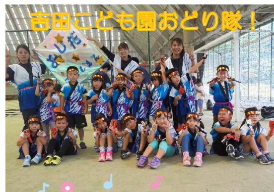
吉田こども園おどり隊!

10月4日(日)に、さくらドームで運動会を行いました。今回は、初の3部制でした。保護者の皆様には、人数制限をお願いしたり、時間差で場内に入ってもらったり、たくさんのご協力をいただきました。ありがとうございました。子どもたちは、運動会をとっても楽しみにしており、当日も自信をもって競技を行っていました。出来たこと、もっと出来るようになりたいこと、いろいろな子どもたちの思いを受けて、今後の保育を計画してまいりたいと思います。