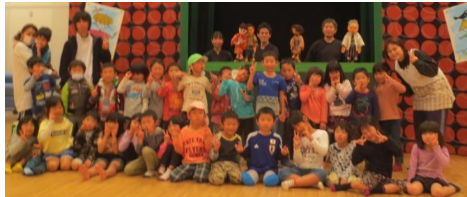
十一月4日、すぎのこ劇団の人形劇「わらしべ長者」を楽しんだすみれ組とさくら組の子も達です。

季節は冬、冬は寒いけれど、雪や霜や氷など、冬でなければ見られないものがたくさんあって、冬でなければ経験できない遊びもたくさんあります。クリスマス、大晦日、お正月、楽しい行事も続きます。行事ごとに、家族だんらんの時間をたっぷり楽しんで下さい。